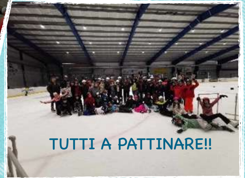
TUTTI A PATTINARE!!