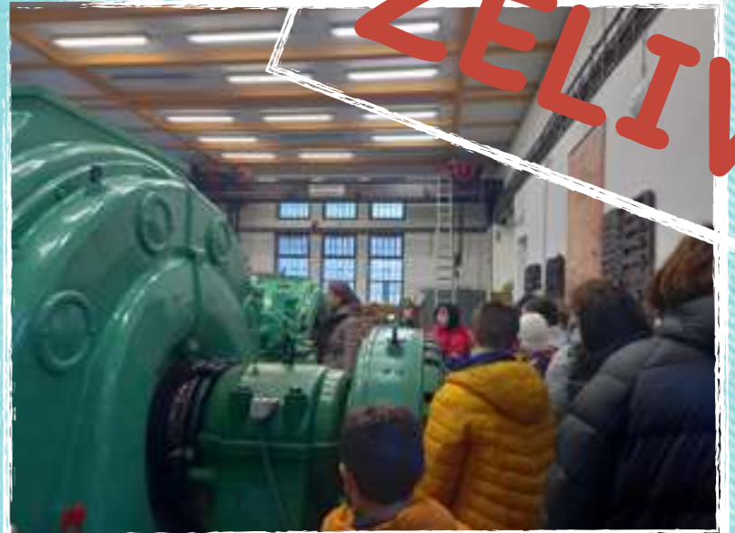
WATER DAM SEDLICE