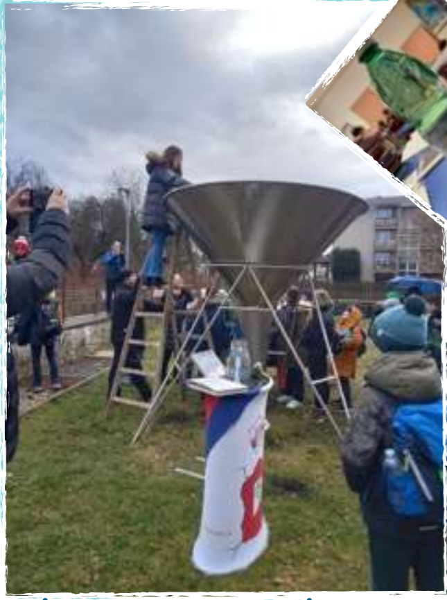
L'ACQUA DELL'ARNO CONTRIBUISCE A UN RECORD